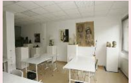
déménagement de l'atelier « Sculpture et Modelage » à la friche Cormouls

à la MJC (bâtiment annexe - 1er étage). Le mercredi de 10h à 11h30 pour les 6-11 ans et le samedi de 9h30 à 11h30 pour les adultes