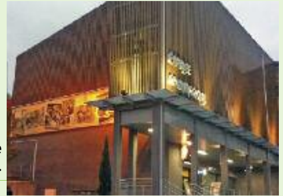
➤ La friche réhabilitée en un espace commercial moderne.