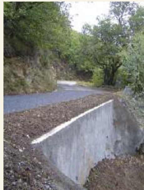
Travaux de réfection de la route menant à la Centrale électrique

WC et Lavabo ont été placés dans la cour de l'école Louis Germain suite à la création d'une nouvelle classe.