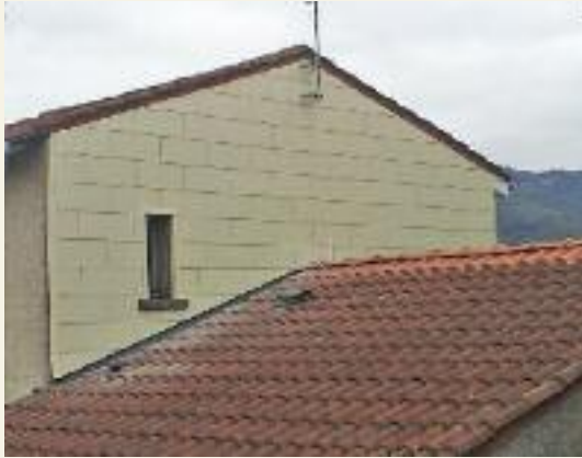
La façade du local médical du dentiste a été isolée.