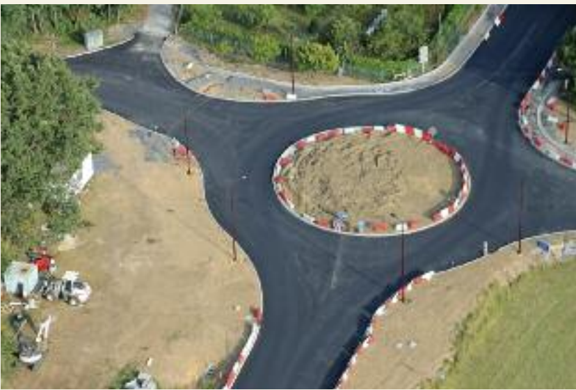
Rond point de Vermeils : nous l'attendions depuis longtemps, c'est fait, nous l'avons !