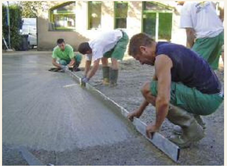
L'équipe technique municipale a refait cet été l'intégralité de la cour de l'école de Rigautou