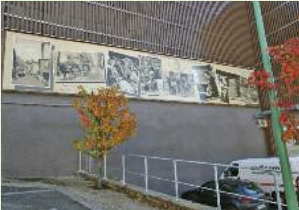
➤ La fresque sur le passé industriel de Pont de l'Arn réalisée par Mr Octave Virgos. "Celle-ci a été positionnée sur la façade ouest de l'ancienne usine où de nombreux Pont de l'Arnais et Pont de l'Arnaises ont travaillé durement pendant des décennies. Les divers tableaux représentent les métiers du délainage: peleurs, sabreurs, magasiniers, courtiers, transporteurs et 2 cartes postales du vieux village...".