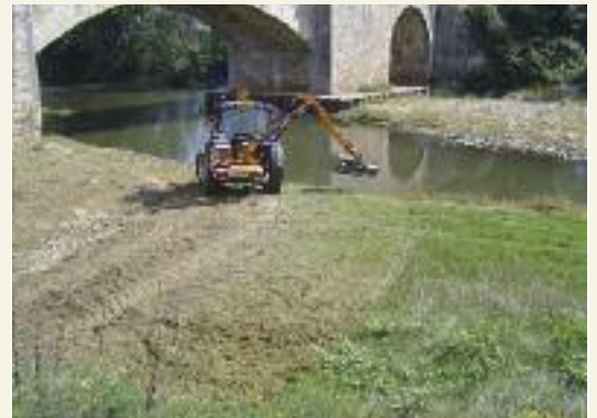
L'épaveuse a facilité le nettoyage du Pont de Rigautou.