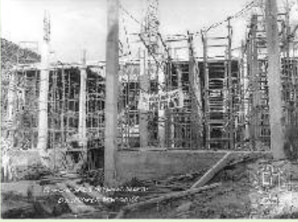
➤ Début de construction de l'usine.