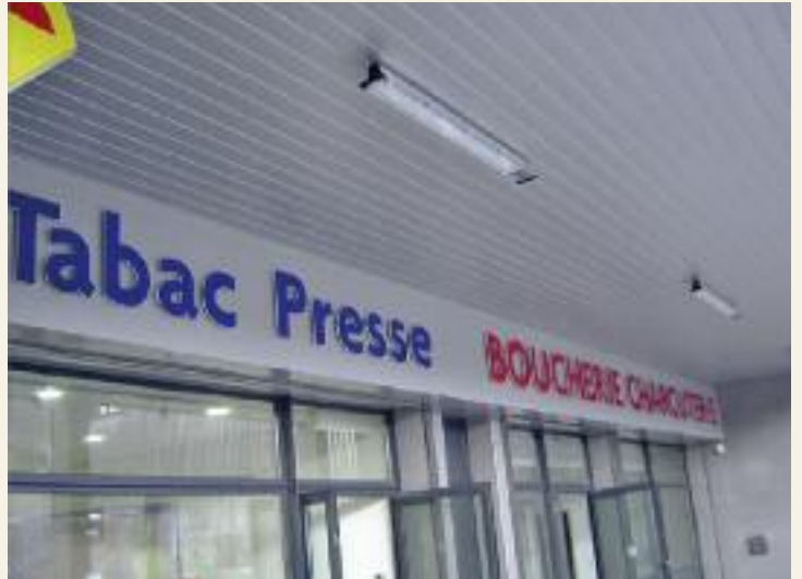
"La Friche Cormouls" réhabilitée : inauguration des commerces le 10 novembre 2012.