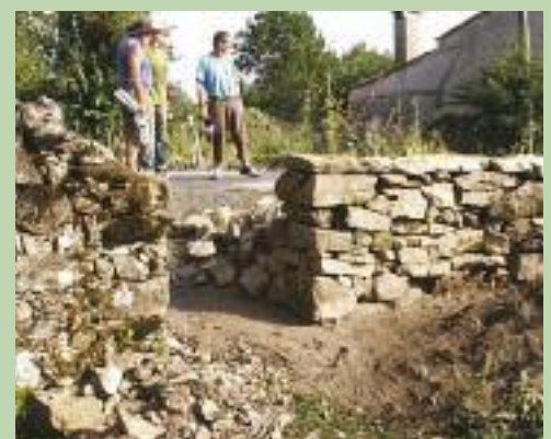
Journée pierres sèches à Rouairoux, le 24 août 2012

Pour les aides qui concerneront les manifestations se déroulant en 2013, un appel à candidature a été lancé. Il a été adressé par courrier aux mairies des communes du Parc naturel régional du Haut-Languedoc. Les organisateurs peuvent donc se renseigner dans leur mairie.