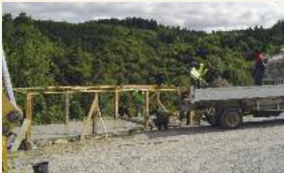
Habillage de containers à Saint-Baudille.