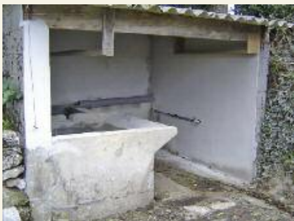
Réhabilitation de la source et du lavoir de la Sarnarié.

Les vestiaires du gymnase ont été repeints.