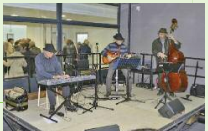
➤ Une animation "Jazzy"