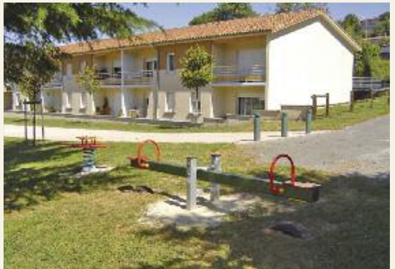
Jeux pour enfants dans le pré de Caminade (à côté de la mairie) et à Rigautou (le mail).