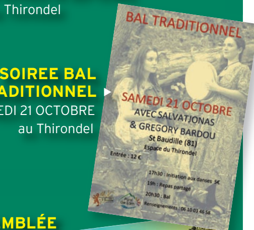
► SOIREE BAL TRADITIONNEL le SAMEDI 21 OCTOBRE au Thirondel