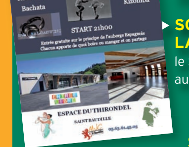
► SOIREE DANSANTE LATINO ROCK le SAMEDI 16 SEPTEMBRE au Thirondel