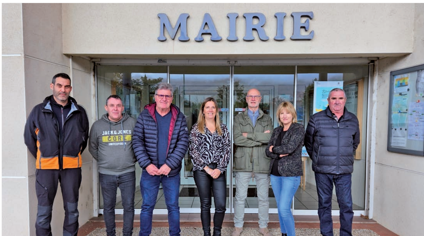
Nos agents recenseurs

A noter qu'en cas de doute sur l'identité d'un agent recenseur ou pour toutes autres questions, vous pouvez vous adresser à la Mairie au 05.63.61.14.05 ou vous rendre sur le site www.le-recensement-et-moi.fr