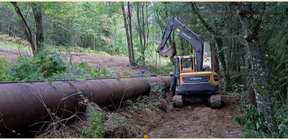
▲ conduite de la centrale