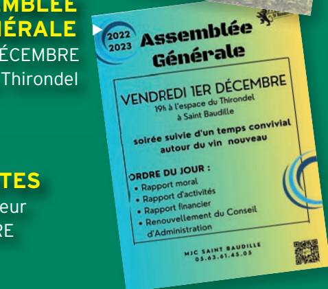
► L'ASSEMBLÉE GÉNÉRALE le 1er DÉCEMBRE au Thirondel