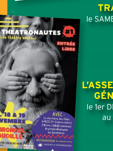
► LES THEATRONAUTES Festival de Théâtre amateur Les 17, 18 et 19 NOVEMBRE au Thirondel