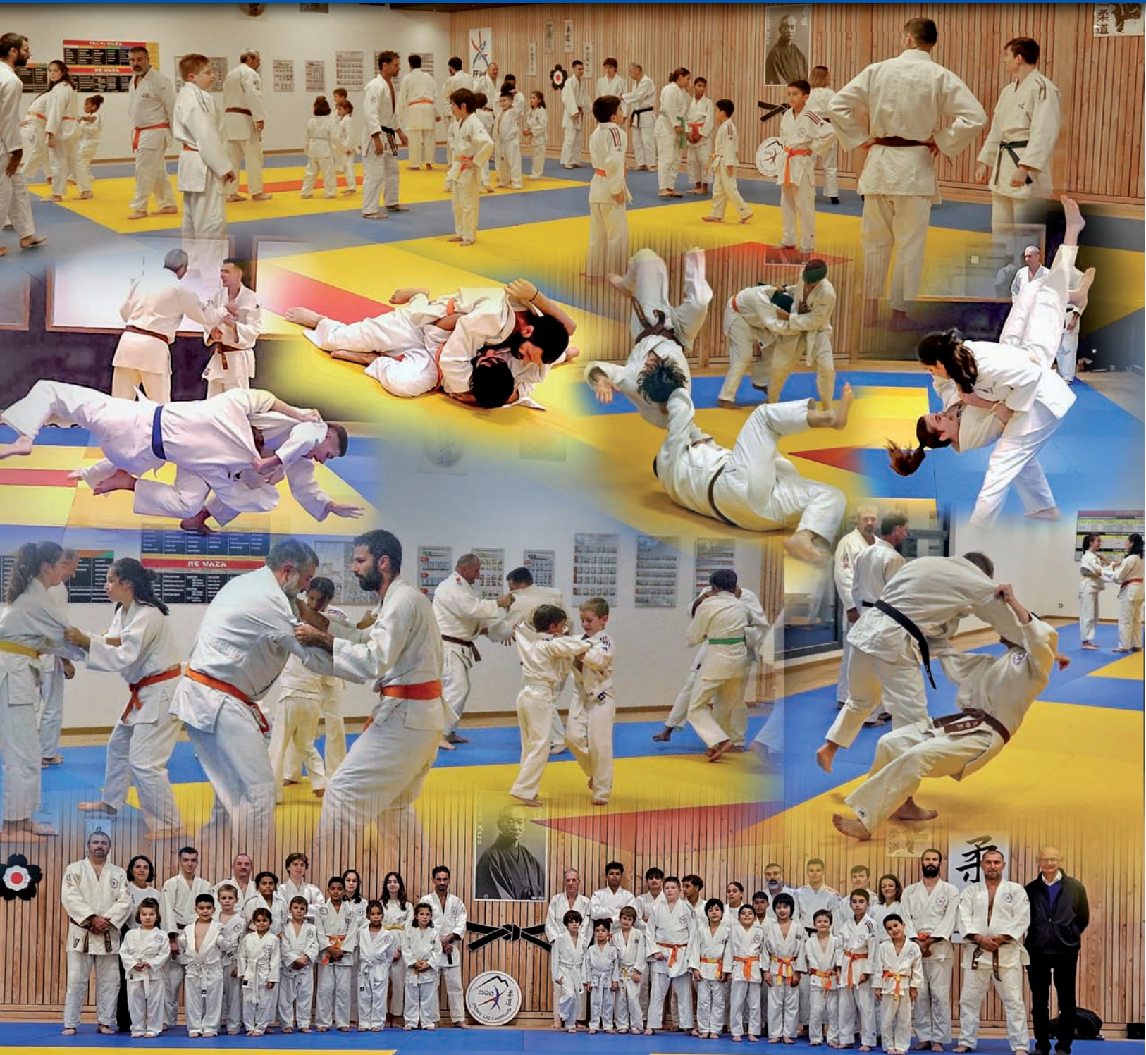
Nouveau Dojo pour les sports de combat (judo, budo, aikido), accessible aux scolaires.