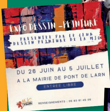
► EXPO DE PEINTURE ATELIERS MJC du 26 JUIN au 5 JUILLET à la mairie de Pont-de-Larn