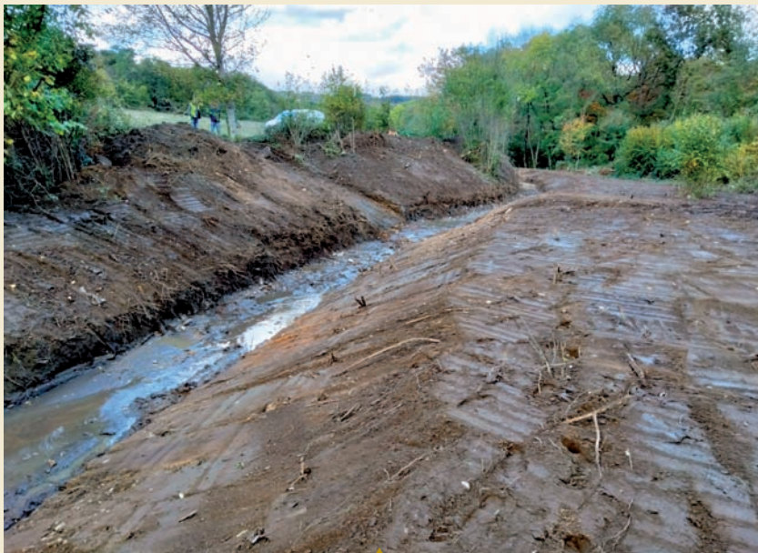
▲ Travaux bras de décharge du Douil