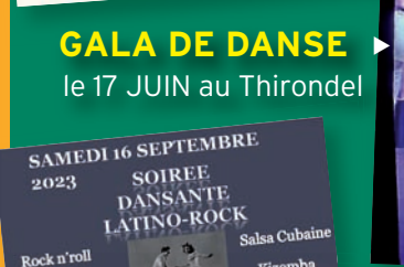
► GALA DE DANSE le 17 JUIN au Thirondel