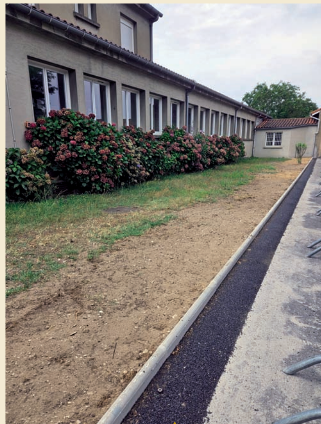
▲ Cour de l'école Louis Germain