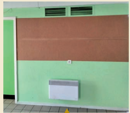
▲ réfection du mur salle du 3ème âge Rigautou