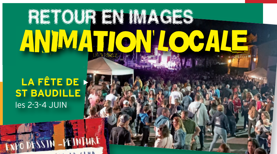
LA FÊTE DE ST BAUDILLE les 2-3-4 JUIN