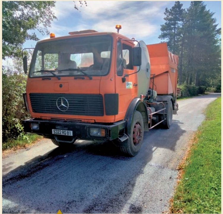
▲ Campagne de goudronnage été 2023